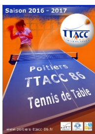
Le calendrier Pro A