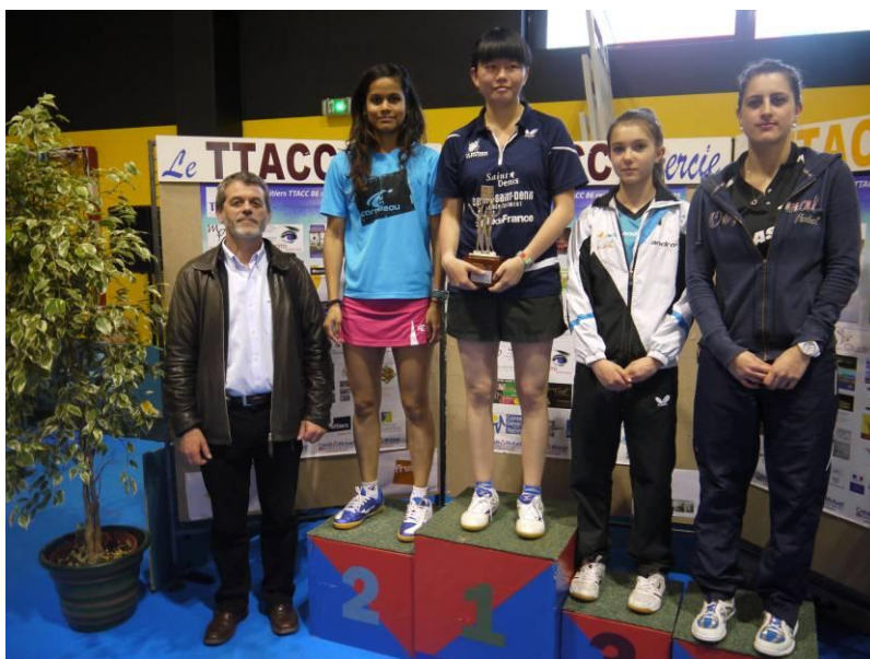
Le podium Elite Dames :

402 joueurs, 2347 parties jouées, 136 clubs représentés, 1412 inscriptions. Challenge du Nombre : NAINTRE