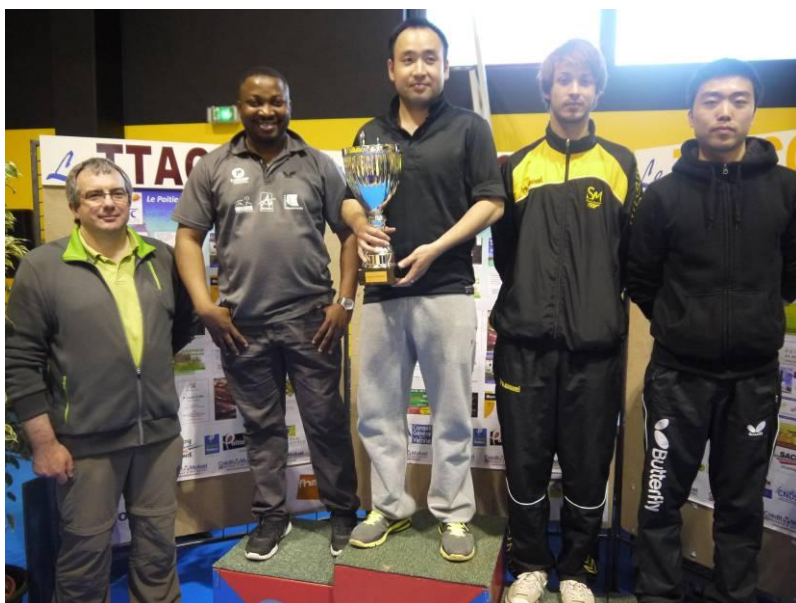
Le podium Elite Messieurs :