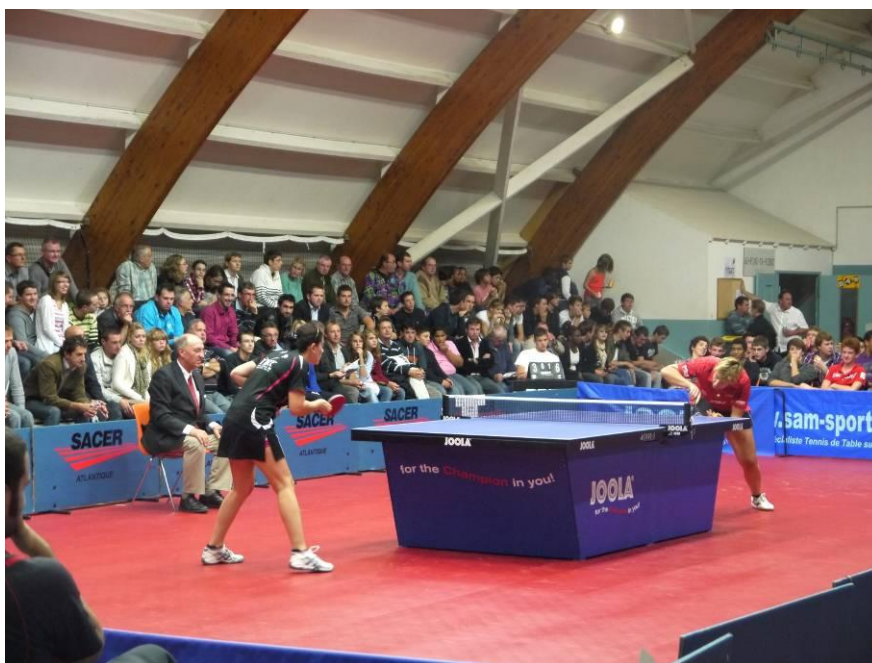
Match de PRO A : le derby aller entre le TTACC 86 et SOUCHE-NIORT en 2012